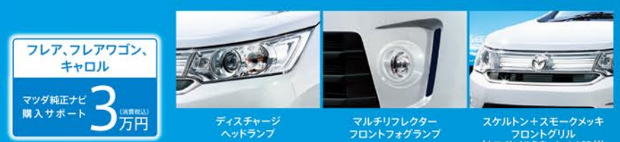
ディスチャージヘッドランプ マルチリフレクターフロントフォグランプ スケルトン+スモークメッキフロントグリル（ホワイトLEDメッキ+LED付）

660 DOHC VVT 2WD(CVT) (8H1311) 車両本体価格 1,461,240円 取得税・重量税 ※2 免税 ※クリスタルホワイトパール、ステールシルバーメタリック、ミスティックバイオレットパールは21,600円（消費税込）高。（消費税込） 掲載車はクリスタルホワイトパールのため車両本体価格1,482,840円（消費税込）となります。