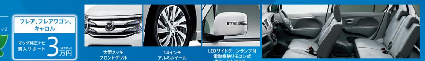
フレア、フレアワゴン、キャロル マツダ純正ナビ購入サポート 3万円 大型メッキフロントグリル 14インチアルミホイール LEDサイドターンランプ付電動折りたたみ式カラードアミラー

660 DOHC VVT 2WD(CVT) (8G1211) 車両本体価格 1,372,680円 取得税・重量税 ※2 免税 ※クリスタルホワイトパールは21,600円（消費税込）高。（消費税込） 掲載車はクリスタルホワイトパールのため車両本体価格1,394,280円（消費税込）となります。